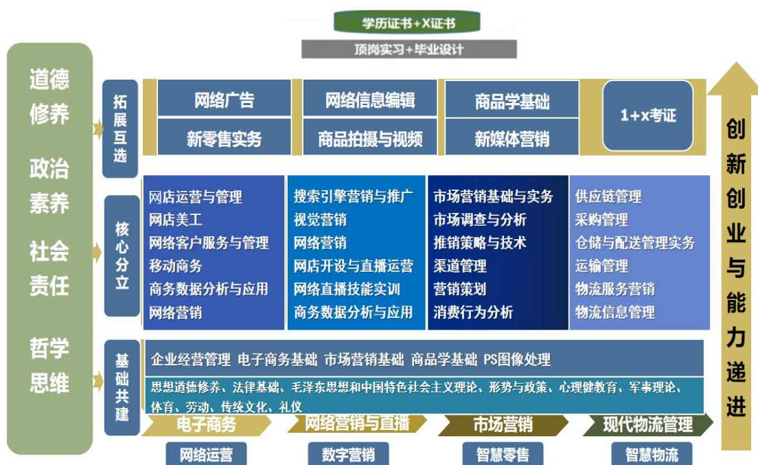
图3 电子商务专业群课程体系

在课程体系建设方面遵循以下思路:首先统筹公共类平台课程与协调多专业共享课程想结合,不断完善基于工作过程的专业群课程体系、形成公共平台与多个专业方向彼此联系、相互渗透、共享开放的课程体系;第二形成电子商务专业群拓展课程库,学生根据岗位需求或者兴趣爱好选修课程库中的有关课程,真正达到拓展互选的目的。